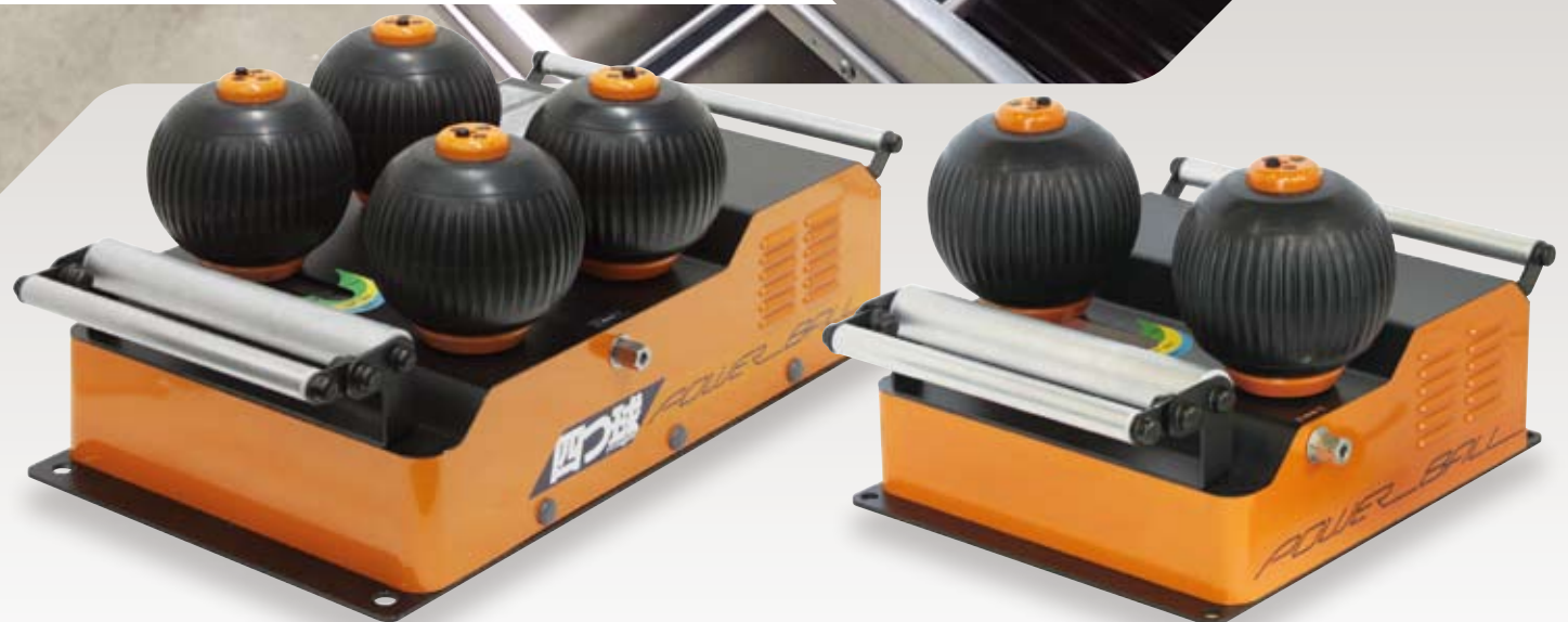
管路の出入り口や ドラムからの送り出しに ISK-PB403